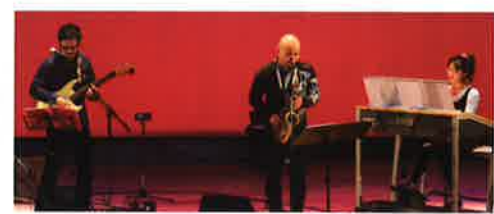
なおりみwithギタックスの皆さん

「なおりみギタックス」の皆さまによるエレキギターとギターとサックスの共演を楽しみ、盛況のうちに閉会となりました。