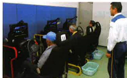
自動車安全運転講習会

高齢者による交通事故が相次いでいますが、高齢者が歩行者側での事故だけでなく、運転手側での事故も年々目立ってきています。当センターでは会員の就業中及び就業途上中の事故防止対策の一環として「自動車安全運転講習会」、「自転車安全運転講習会」を開催しました。