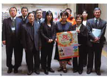
実行委員の皆さん

企画・立案、運営に携わっていただいた実行委員の皆さんには大変お世話になりました。