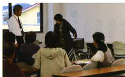
自転車安全運転講習会