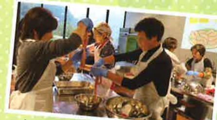
女性部日帰り研修(ソーセージ作り)