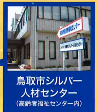
鳥取市シルバー人材センター (高齢者福祉センター内)