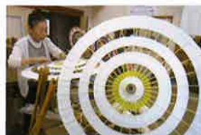
素張り しゃんしゃん傘を飾りつけする前の状態